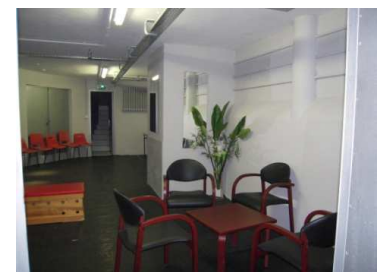
Dessous de scène

SORTIES SECOURS : 3 donnant dans la rue Ste Hélène et 3 dans la cour du lycée.