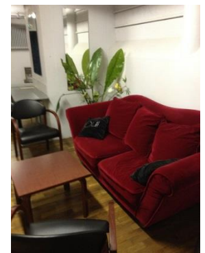
Dessous de scène